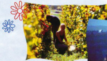
Weinlese in Reicholzheim

Ausgangspunkt: Rathaus Wertheim Streckenlänge: 20 km Wanderzeit: 5 Stunden Höhenunterschied: 160 m