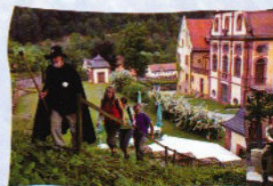
Rast in der Brunnenstadt Külshelm