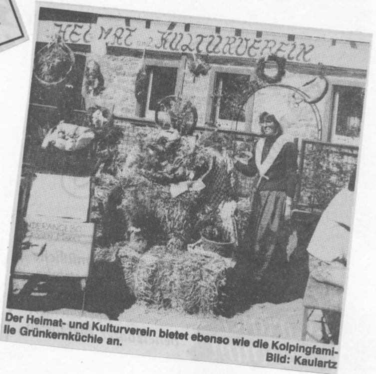
Der Heimat- und Kulturverein bietet ebenso wie die Kolpingfamilie Grünkernküchle an.

Photo vom Letztjährigen (1988) Stand unseres Vereines der der Sanierung zum Opfer fallen wird