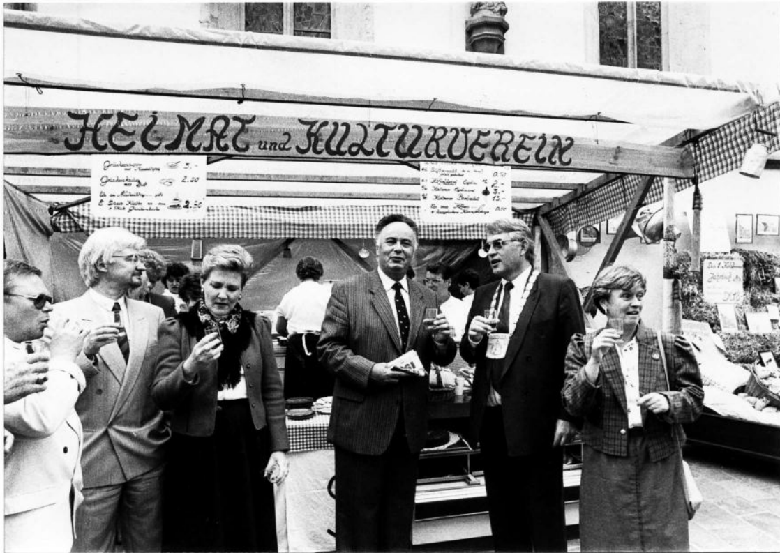
Prominentenbesuch am Sonntagvormittag ... Auch ihnen schmeckt der " Hiffelder "