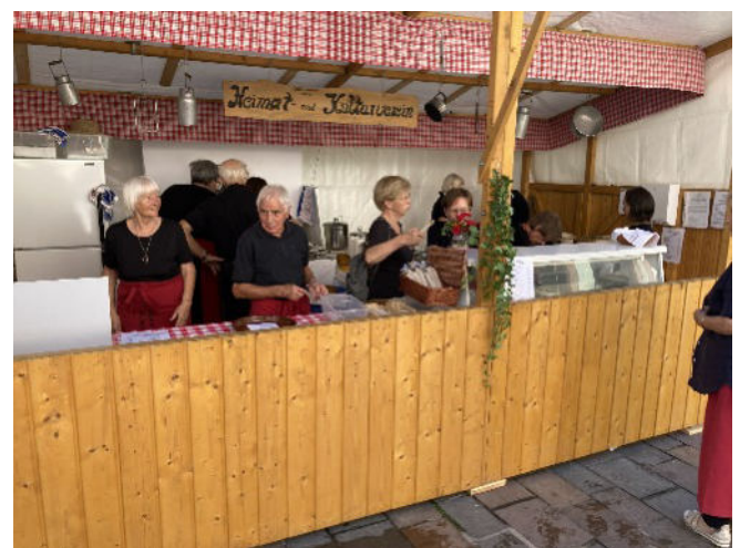
Helfer im Stand