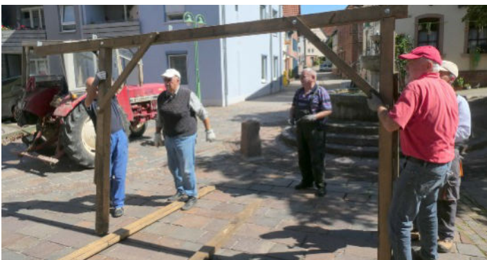
Aufbau überdachter Sitzplatz