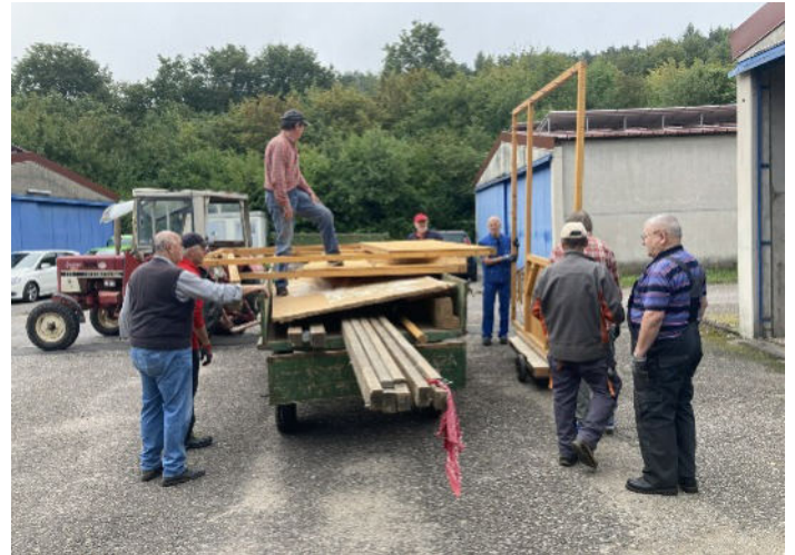
Aufladen der Bauteile des Standes