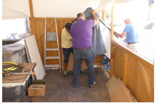
Transport des Kühlschranks vom Haus zur Hauptstrasse