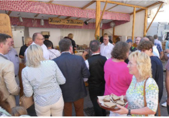
Nach dem Politischen Frührschoppen Besuch der Prominenz mit Manuel Hagel, Vorsitzender der CDU- Landtagsfraktion, am Stand des HKV.