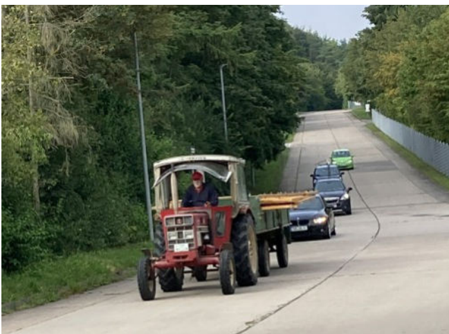
Transport zum Standplatz