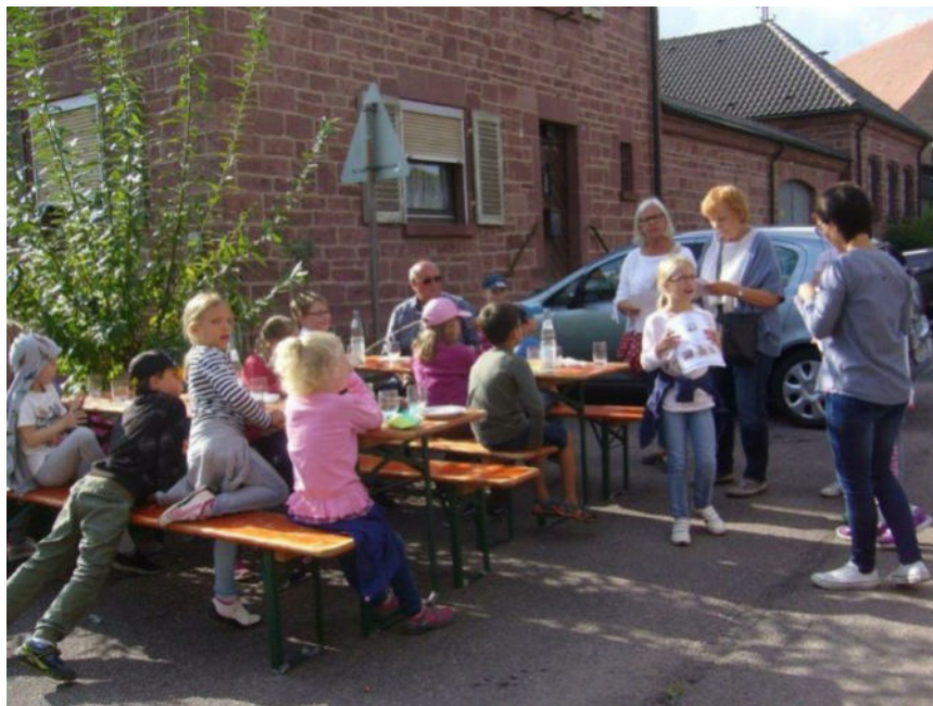
Bilder: Egon Kirschner