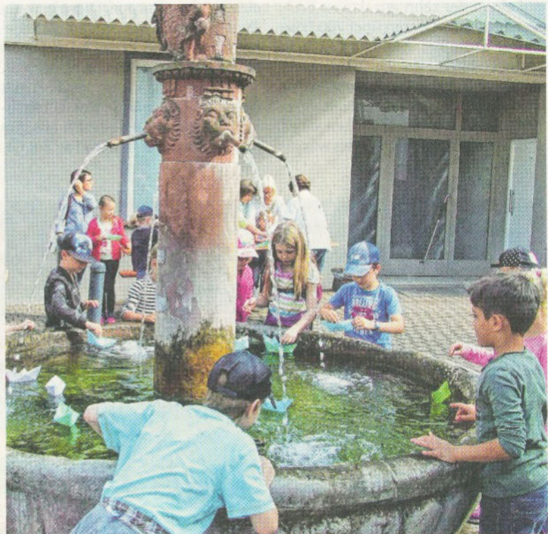
Am Weedbrunnen durften die Kinder beim Ferienprogramm Papierschiffchen zu Wasser zu lassen.

Am Rathausbrunnen dann stand das Optische im Vordergrund. Die