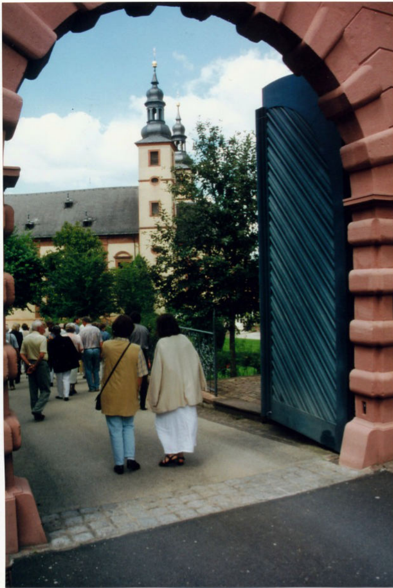
Kloster Triefenstein Eingangstor