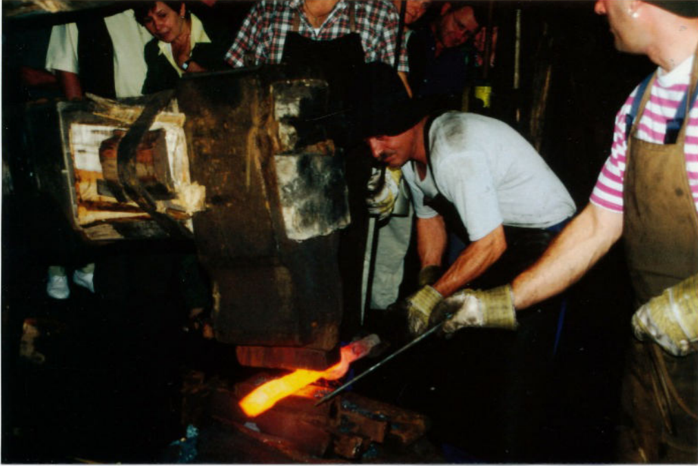
Der Eisenhammer von Hasloch ...