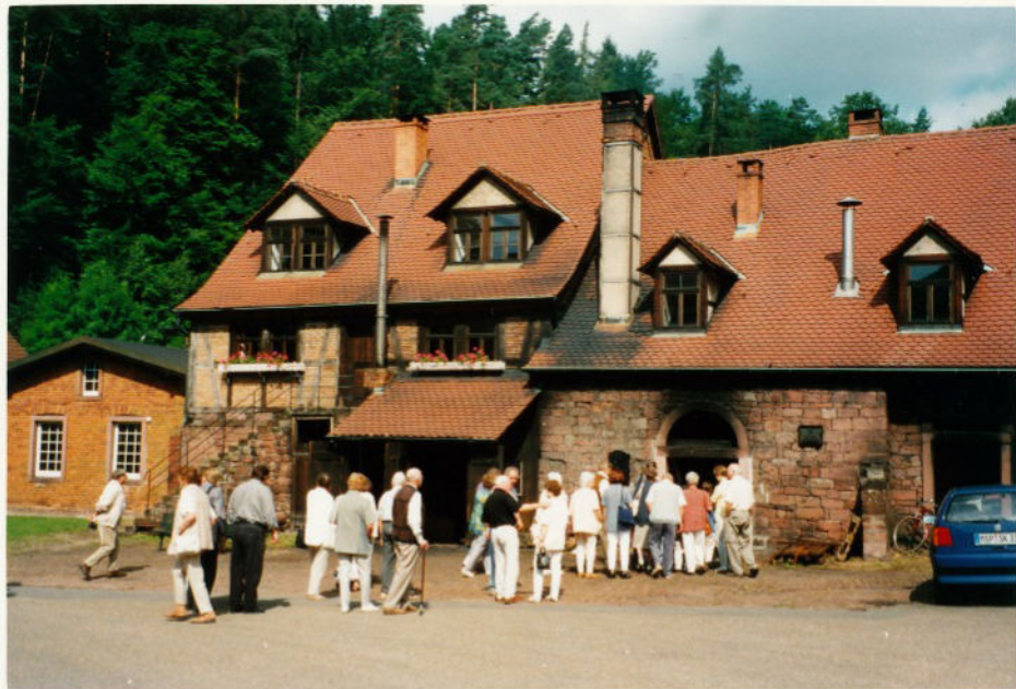
Eingang zur Hammerschmiede ...