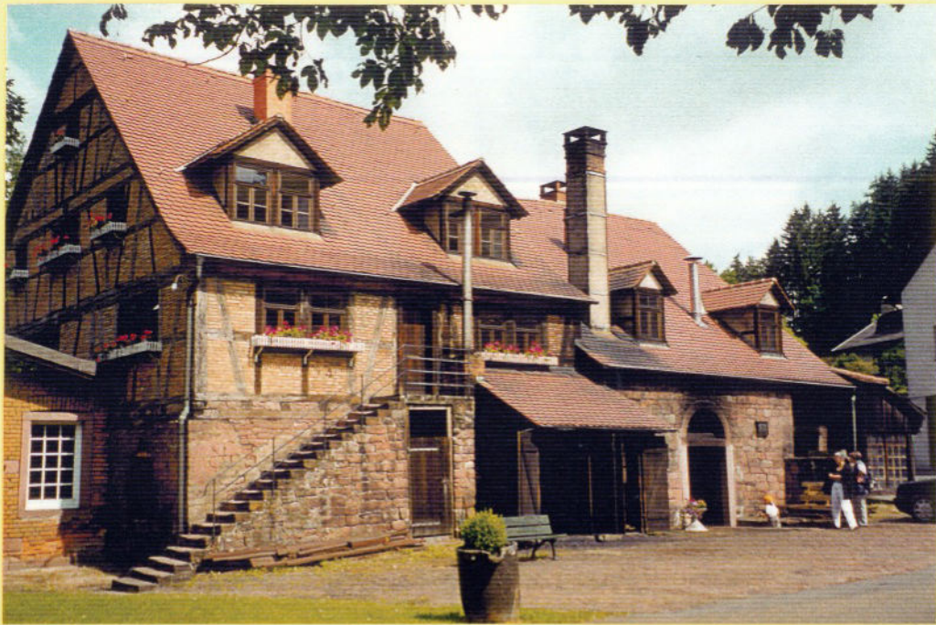
Der Eisenhammer im Haslochbachtal