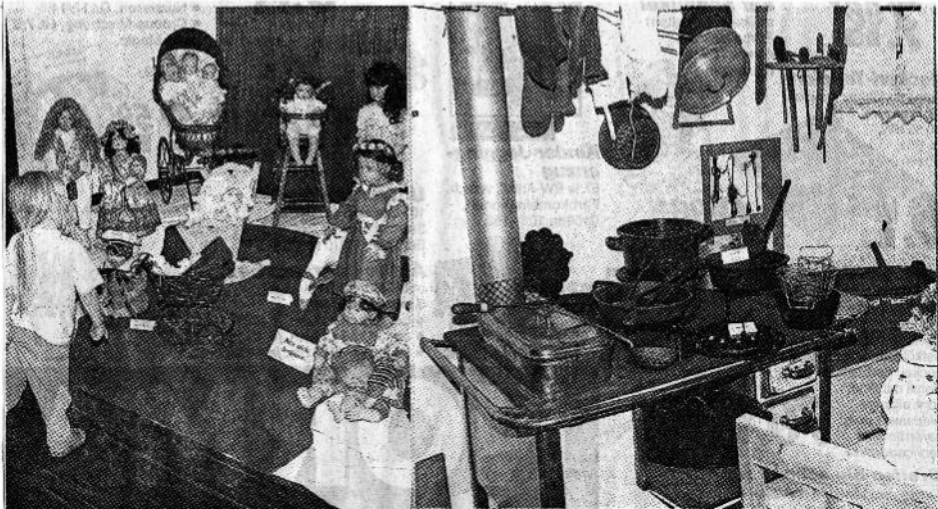
Sehr abwechslungsreich waren die vier Ausstellungen, die beim Großen Markt in der Külshcimcr Festhalle zu sehen sind und zum Teil noch heute gezeigt werden. Einblick in seine Arbeit gaben der Külshcimcr Kunst-Kreis, der Heimat- und Kulturverein