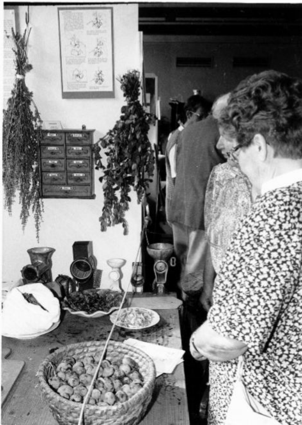
Bild oben: Küchenausstattung wie wir sie noch kannten... heute museumsreif !

Es herrschte reger Zuspruch und so manche Besucherin erkannte sicherlich noch das ein oder andere " gute " Stück, mit dem sie selbst noch gearbeitet hat ... Bild unten: