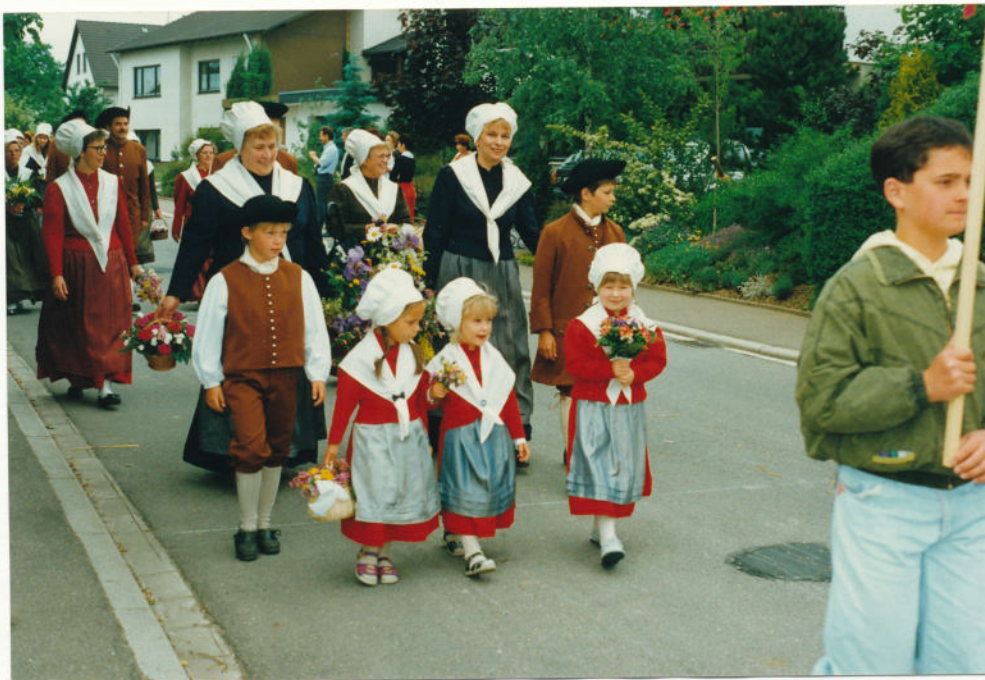
... und los geht's ... Die Kinder vorneweg