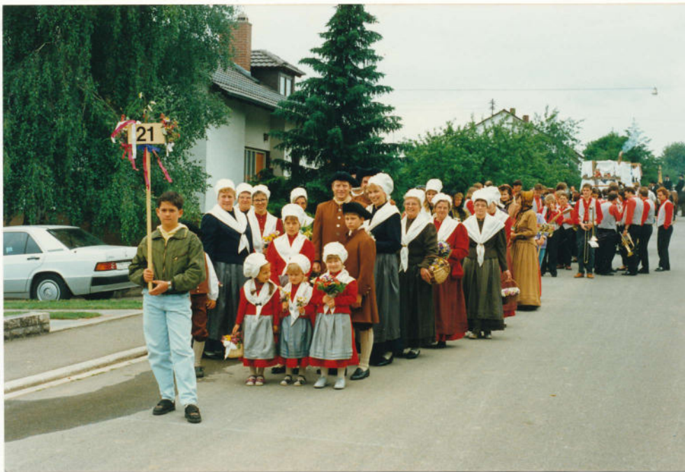
Der Zug formiert sich