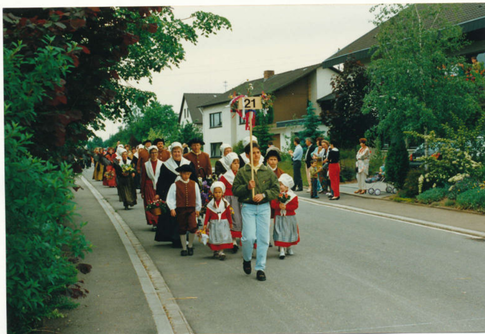
Wir wußten garnicht, daß es in Wissigheim so viele Straßen gibt